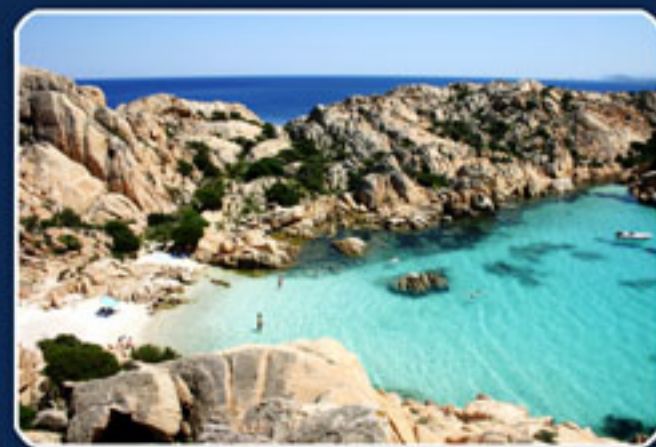
Cala Coticcio - Isola di Caprera Arcipelago di La Maddalena