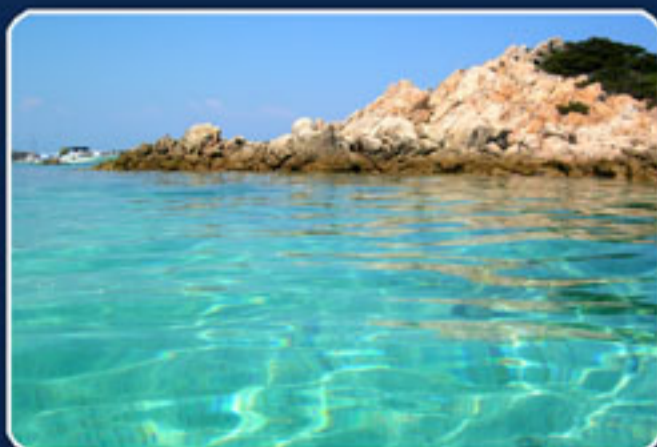
Porto della Madonna - Isola di S. Maria Arcipelago di La Maddalena